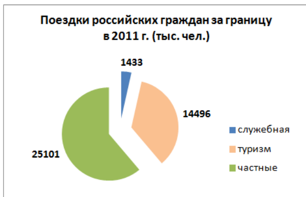
Рис. 3. Диаграмма 2 для задания 18